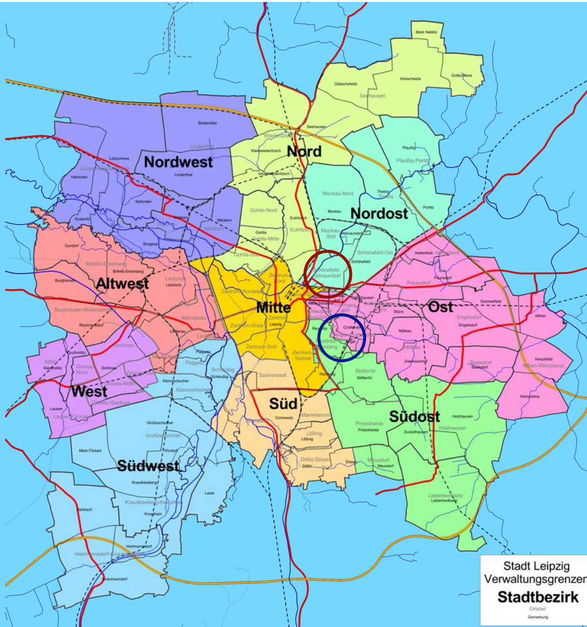
Stadt Leipzig Verwaltungsgrenzen Stadtbezirk Ortsteil Gemarkung